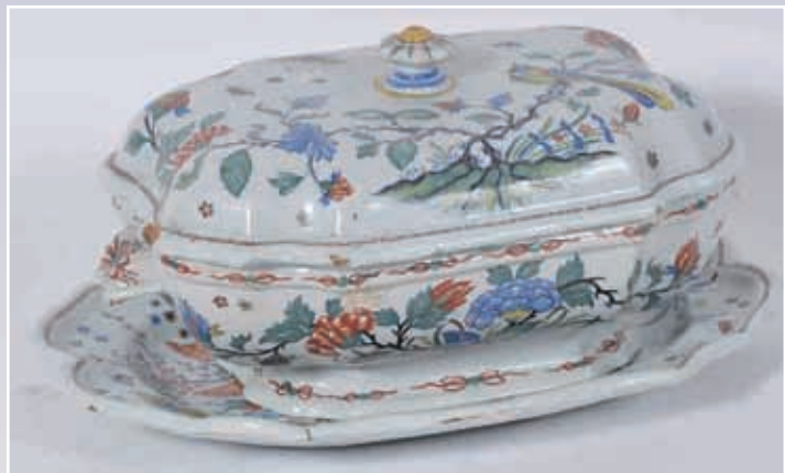
Terrine couverte et présentoir en faïence polychrome à décor rouennais aux oiseaux et à la corne tronquée. Attribuée à Porquier, non signée (accidents)