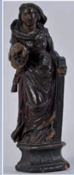
Statuette en bois sculpté polychrome et or représentant « Ste Ursule », époque fin XVI e , début XVII e Hauteur 46 cm