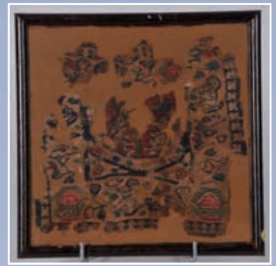
Fragment de tissu « Copte » Scène nilotique polychrome, Egypte VI e - VII e siècle 25x25