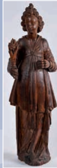
Statuette bois sculpté H : 80cm époque fin XVII e (Restauration main gauche et bouquet)