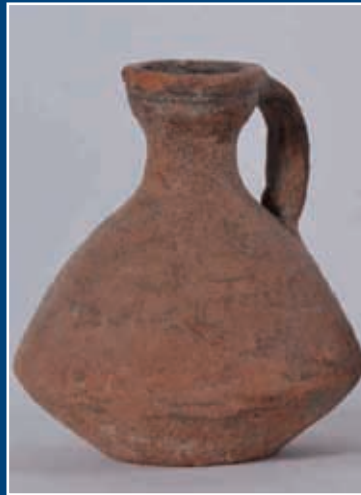
Un vase en terre cuite Carthage, époque romaine et une amphore à une anse en terre cuite Carthage, époque romaine Hauteur 17 et 19 cm (n° 43 et 44)