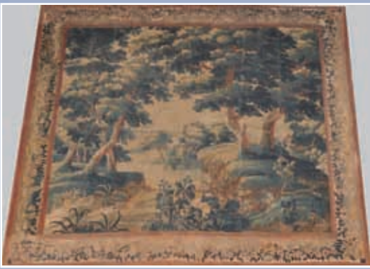
Tapisserie type Verdure décor d'un paysage architecturé et arboré à la rivière. Bordure feuillagée Aubusson XVIII e - 250x260