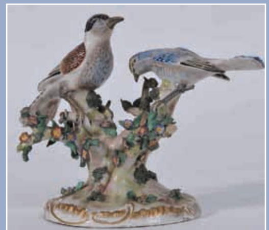
Deux oiseaux branchés époque fin XIX* style Meissen