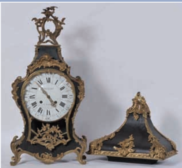
Cartel d'applique en bois naturel cadran marqué BECKERS à Paris, belle garniture de bronzes ciselés décor feuillagé époque Louis XV mouvement à lame XIX e H:130cm env