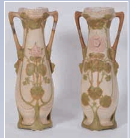
Paire de vases en porcelaine Royal Dux décor floral en relief H : 48cm