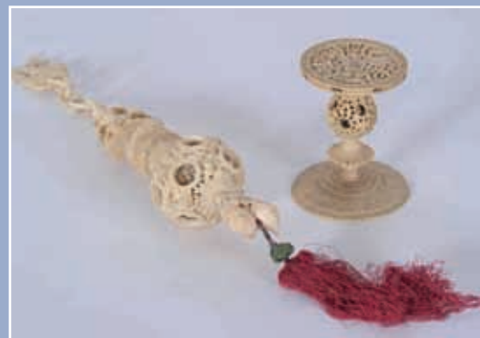
Boule de canton en ivoire surmontée de deux personnages L 33 CM