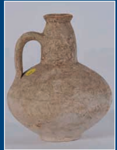
Petite amphorisque époque romaine