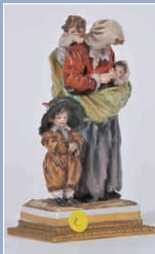
Famille de mendiants en porcelaine polychrome marque aux épées Saxe XIX*