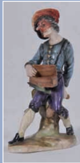
Personnage de La Comedia Del Arte Capodimonte XIX*