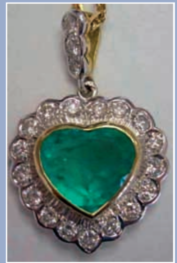
D'un bel ensemble de bijoux, or, rubis, saphirs, émeraude et diamants... Liste et descriptif sur www.thierry-lannon.com