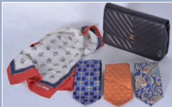
D'un ensemble d'accessoires de mode