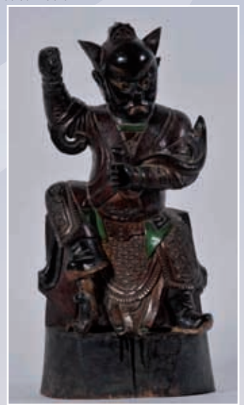
Statuette en bois sculpté polychrome d'un gardien de Buddha style Kang Hi Hauteur 52 cm

EXPOSITIONS : Espace Port de Plaisance de l'Hôtel des Ventes, 250 rue Alain Colas - 29200 BREST - FRANCE