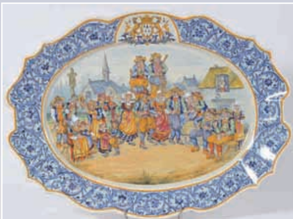
Très grand plat ovale festonné décor d'une scène de danse Henriot Quimper 50x60