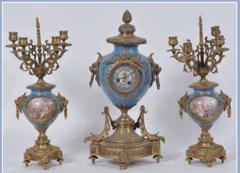
Belle garniture de cheminée comprenant pendule et paire de candélabres corps en porcelaine à fond bleu décor en réserve de scènes galantes signées P.Philippot. Epoque Napoléon III H:53cm