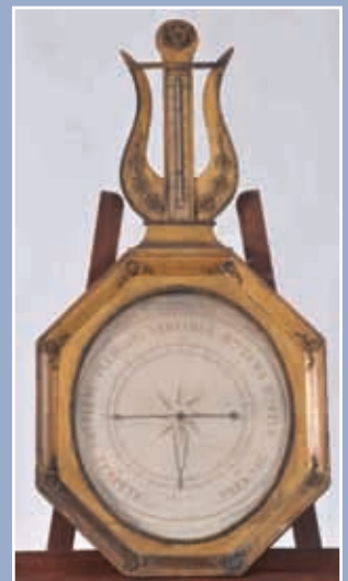
Baromètre en tilleul doré, époque Louis XVI. Toricelli