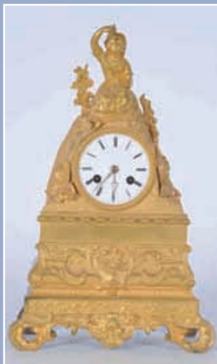
Pendule en bronze doré décor d'une femme assise tenant une grappe de raisin époque Romantique 1840/1850 H:34cm