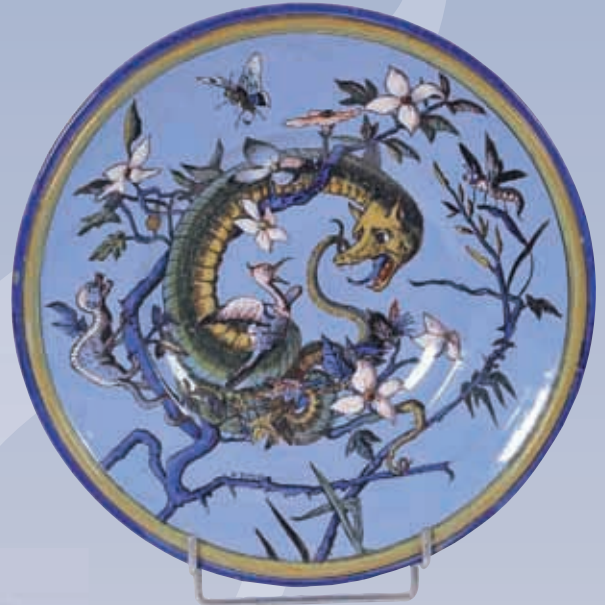
Rare plat HB 1° marque signé Darnal décor d'un dragon sur fond bleu Diam : 33cm égrenure au dos