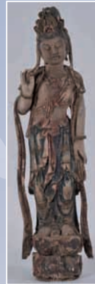
Kuan Yin en bois sculpté polychrome style Song ornée d'un collier de Jade Hauteur 100 cm