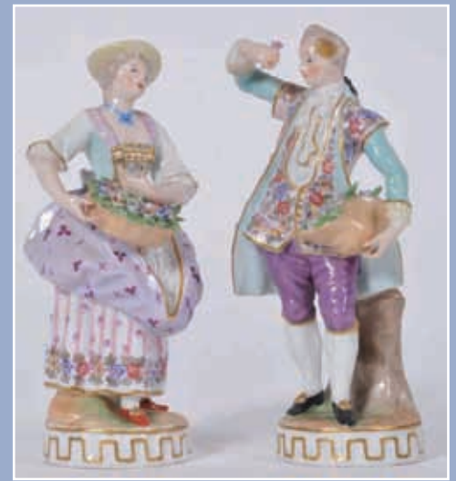
Homme et femme au panier de fleurs marque aux épées époque XIX*