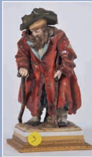
"Le Mendiant" porcelaine polychrome marquée aux épées Saxe XIX*