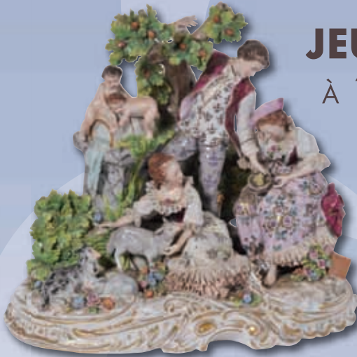
"Le nid" important groupe en porcelaine polychrome Capodimonte fin XIX°