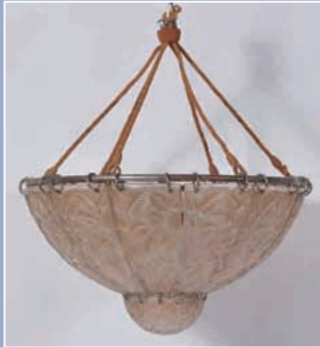
Suspension en verre moulé pressé décor feuilles de charme blanc signé R.LAIQUE Diam 48cm H:30cm (copie de la facture d'achat du 21 février 1929)