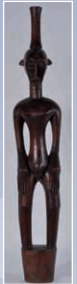
Statuette en bois sculpté M'Délélé, Côte d'Ivoire Hauteur 130 cm