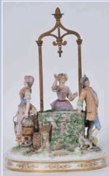
Grand groupe en porcelaine polychrome Saxe fin XIX e décor de trois personnages et d'un enfant autour d'un puits 40x30