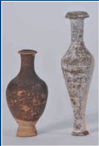
Deux lampes à huile en terre cuite II e siècle avant J.C