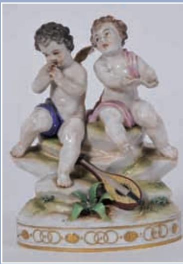
Chérubin chanteur et angelot musicien Saxe fin XIX*