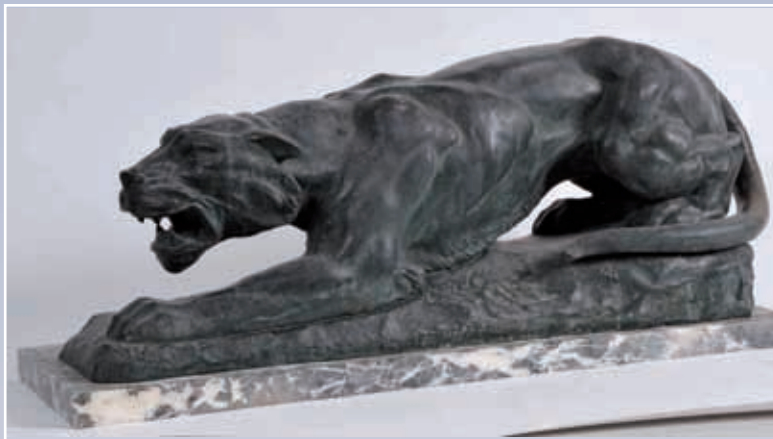
A.CIPRIANI "Le tigre" bronze signé 68x28)