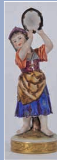
Jeune paysanne au tambourin Saxe XIX*