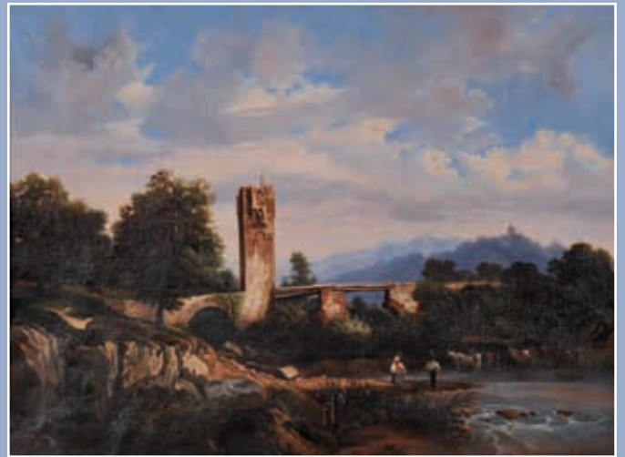
Ecole française première moitié du XIX e "Gardiennne de troupeau en bord de rivière près du pont" Toile 54x73