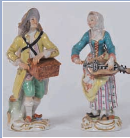
Femme à la vielle style Meissen époque XIX*