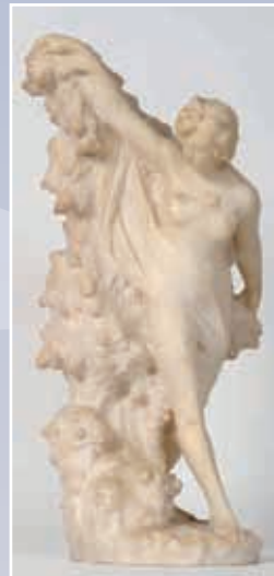
Giuseppe GAMBODGI (XIX e -XX e ) "Baigneuse au rocher" albâtre 65x24x20