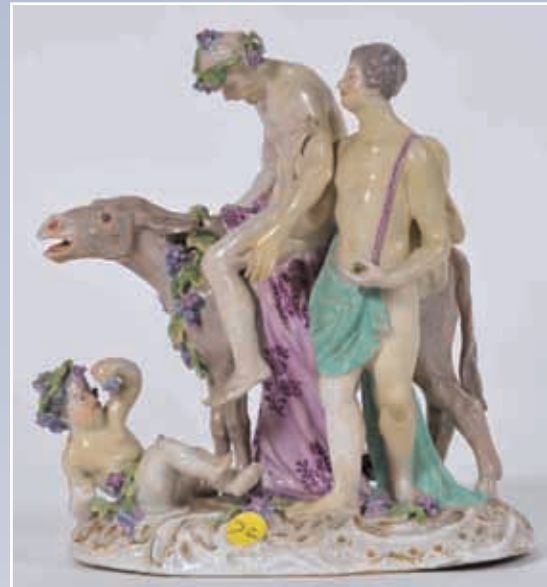
Groupe en porcelaine de Meissen XIX e "L'ivresse de Bacchus" d'après Meyer (accident)