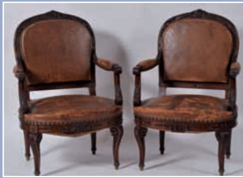
Paire de fauteuils en acajou richement sculptés de motifs feuillagés, style Transition Louis XV, Louis XVI assise et dossier cuir