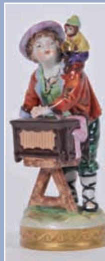
Jeune garçon au singe musicien Saxe XIX* H: 14cm