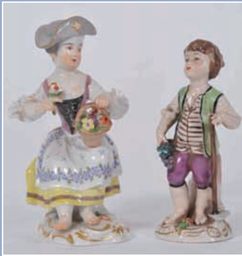
Jeune garçon et petite fille au panier de fleurs Saxe fin XIX* (petits accidents)