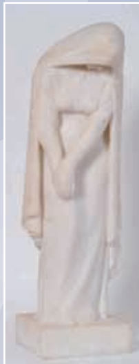
M.MANUEL "Méditation" albâtre signé H : 78cm