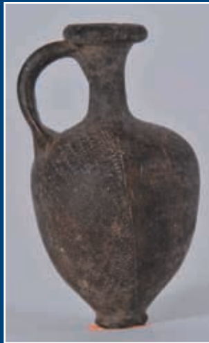
Amphorisque en terre cuite gravée de pointillés Phénicie II e millénaire avant J.C.