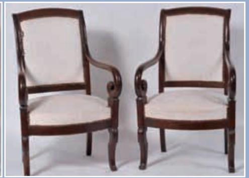
Paire de fauteuils à crosses époque Restauration