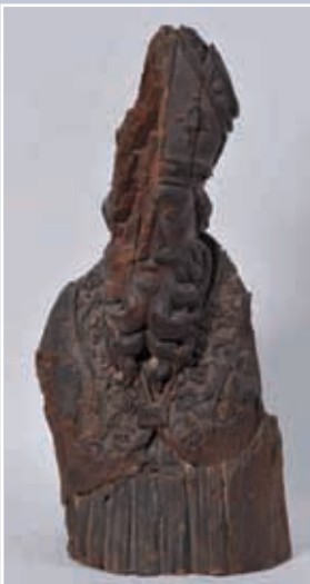
Buste d'évêque en bois sculpté XVIII e H : 71cm