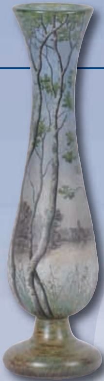
Grand vase à col en verre multicouche déposé à l'acide au décor d'un paysage lacustre. Signé DAUM Nancy H : 59cm