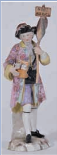
Le dératiseur Saxe XIX*