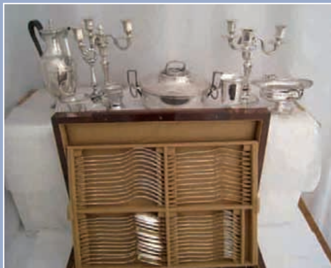
Ménagère de 98 pièces argent poinçon Minerve: 12 couverts de table, 12 couverts à poisson, 12 cuillères à café, 12 cuillères à moka, 1 service à ragout, 12 couteaux de table et 12 couteaux dessert manches argent lames inox. Modèle filet en coffret bois PB:6860g Poids sans les couteaux:4250g