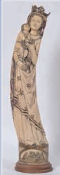
Vierge à l'enfant en ivoire sculpté H 78 cm (accident à la couronne) XIX e