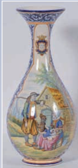
Grand vase à col décor d'un faucheur rentrant du travail H : 58cm Henriot Quimper