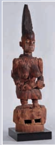
Grande maternité sculptée en bois sculptée polychromée, YORUBA Hauteur 120 cm - Expert Cabinet Schoeller, 15 rue Drouot, 75009 Paris (tél 01 47 70 15 22)