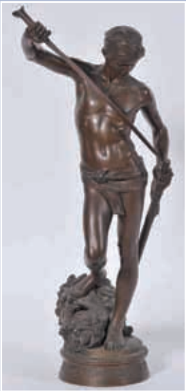
A MERCIER "David" bronze H 62 cm