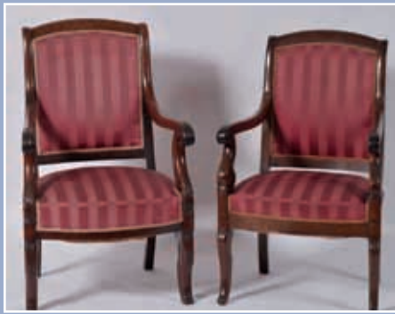
Deux fauteuils en acajou sculpté et mouluré. Epoque Restauration