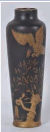
Vase porcelaine à fond noir et or à décor d'un aigle, serpent et feuillage signe PINON-HEUZE H 49