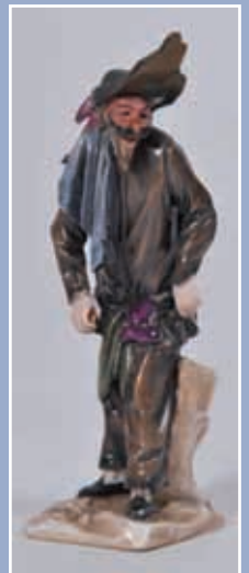
Personnage de La Comedia Del Arte XIX*