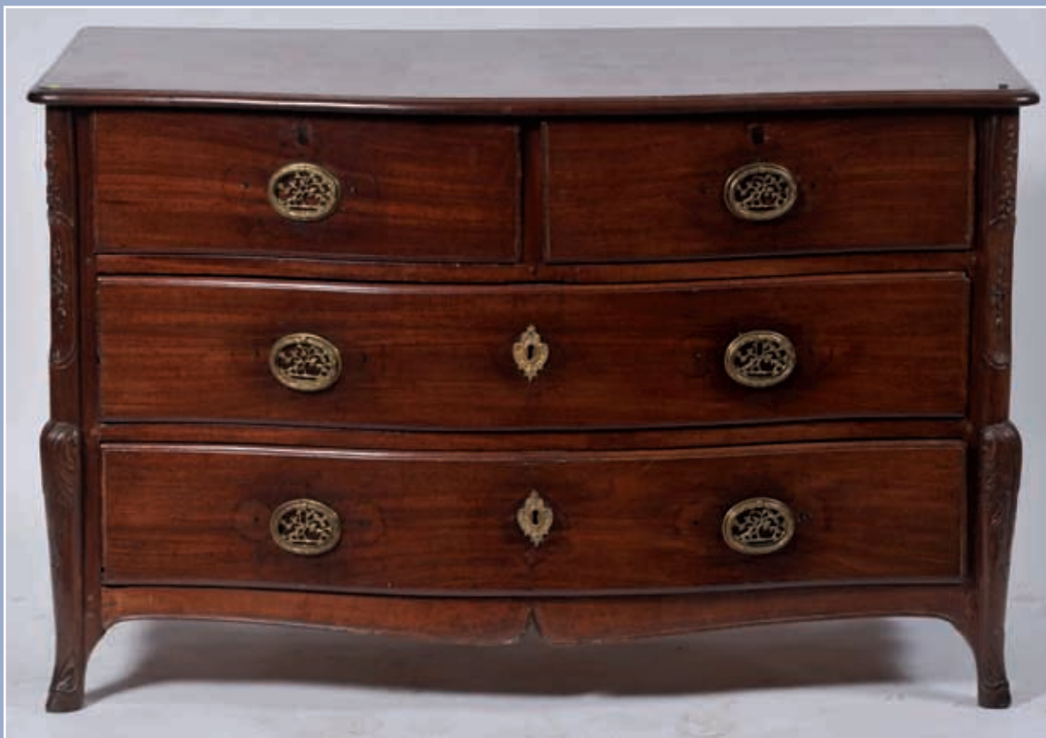
Belle commode en acajou massif ouvrant par quatre tiroirs sur trois rangs avec traverse. Montants sculptés en décrochement de feuillages et motifs floraux. Pieds en sabots, ceinture moulurée. Travail de Port, époque Transition XVIII°. Attribué à St Malo 82x127x71