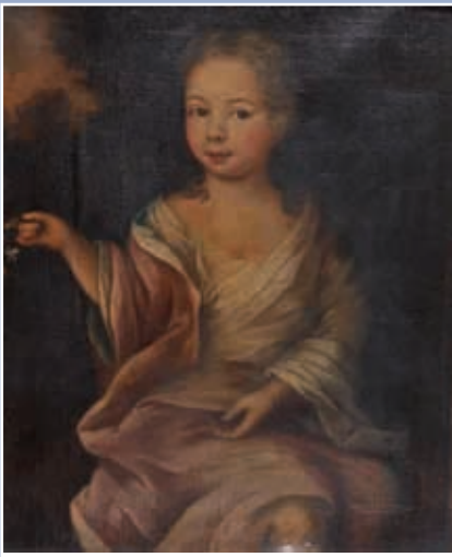
Ecole française fin XVIII e "Jeune fille" toile 65x50