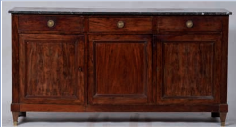
Enfilade en acajou et placage d'acajou ouvrant par trois portes et trois tiroirs, plateau marbre gris veiné blanc, piétement gaine. Travail Directoire, époque XIX° 99x190x49