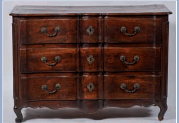
Commode en noyer massif, façade arbalète, époque Louis XV