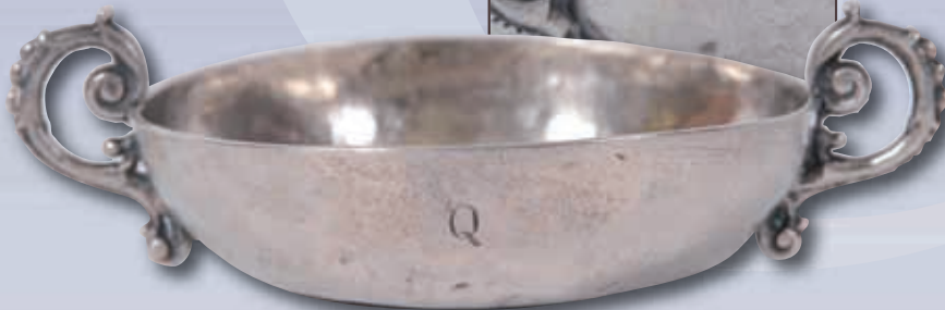
Très rare coupe de mariage en argent uni le fond stylisé au décor d'une croix dans un double encadrement perlé. Deux anses en argent fondu en volutes perlées rapportées. La Coupe est gravée "NOVEL GoARDON 1681" Poinçon indéterminé "F" et "B" travail fin XVII° P:85,3g